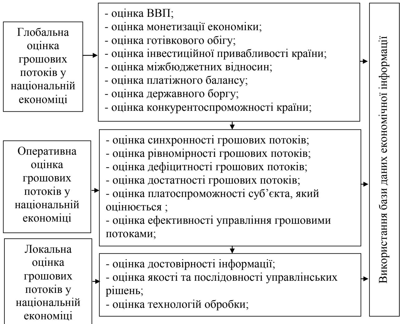
Рис. 2. Складові комплексної оцінки грошових потоків національної економіки (авторська розробка)

послідовності управлінських рішень щодо грошових потоків. Оперативна оцінка грошових потоків необхідна для більш детальної оцінки саме грошових потоків об'єкта, що підлягає діагностиці і стану його грошових потоків.