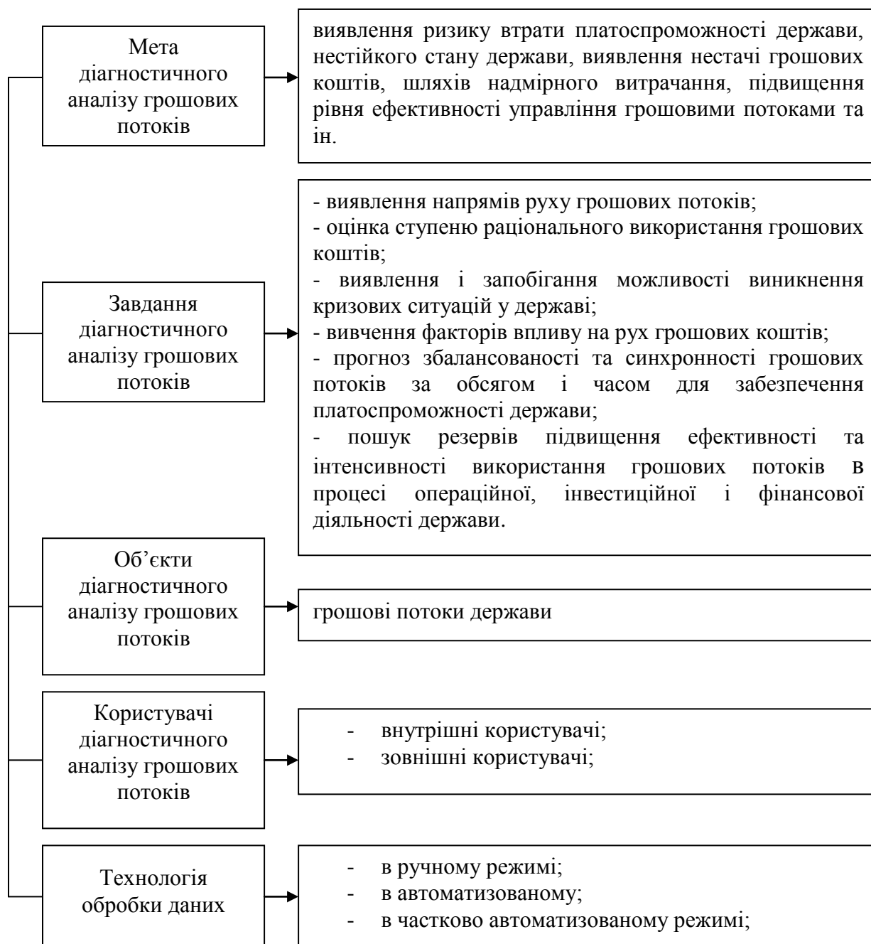
Рис. 1. Складові діагностичного аналізу грошових потоків національної економіки (авторська розробка)