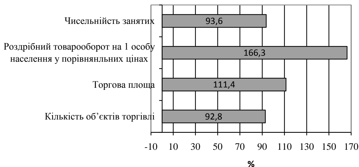
Рис. 2. Темпи зростання окремих показників розвитку роздрібно́ї торгівлі України у 2011 р. до 2008 р.

Є підстави стверджувати, що попри низку позитивних тенденцій, окремі важливі індикатори розвитку сфери товарного обігу України погіршуються. Так, в Україні спостерігається стійка тенденція до зменшення кількості об'єктів роздрібно́ї торгівлі (на 37,8 % у 2011 р. до 2000 р. та на 7,2 % до 2008 р.) та їх укрупнення, що об'єктивно призводить до погіршення конкуренції та зростання монополізації галузі. Крім того, на разі не відновлено докризових значень ще й такого показника розвитку торгівлі, як чисельність зайнятих (рис. 2). Кількість зайнятих зменшилися за аналізований період на 6,4 %.