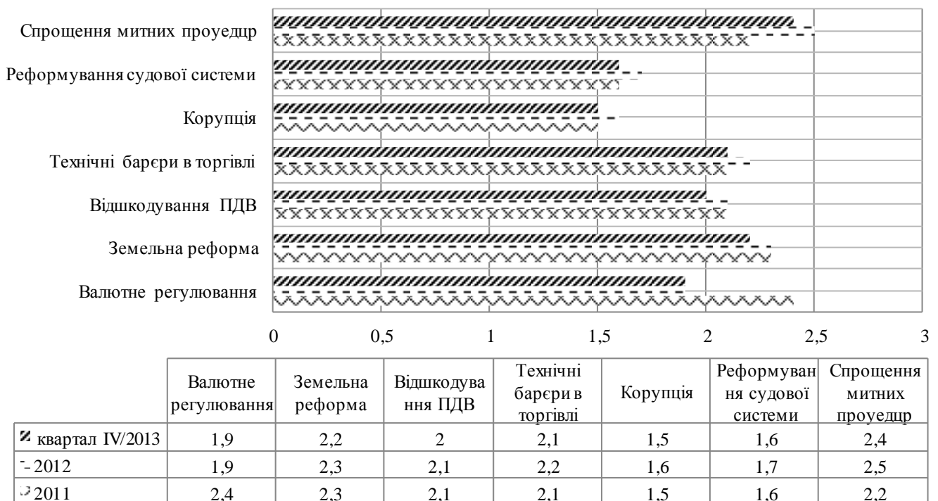
Рис. 3. Динаміка оцінок ситуацій з розв’язання проблем за сферами економіки України протягом 2011 – 2013 рр.

В оцінці ситуацій з розв’язанням проблем, які мають безпосереднє відношення до інвестування, експерти не відзначили зрушень в жодному з напрямків (див. рис. 3).